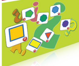
Задания SMART Table